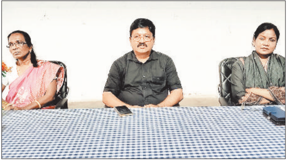
कार्यक्रम में उपस्थित प्रशिक्षक व शिक्षक